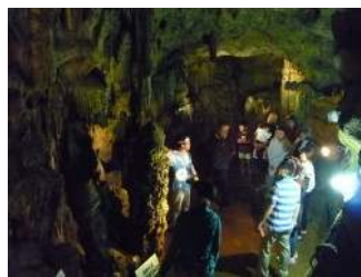
ガイド付き鍾乳洞探検