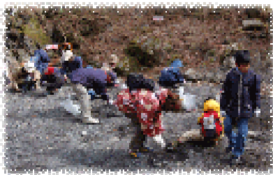
神流町恐竜センター (化石発掘体験)

※1棟を2名様で利用の場合は上記金額に1人2,000円増し(大人、中学、小学生)